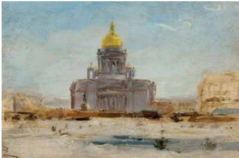
Félix Ziem, Saint Pétersbourg, Saint Isaac , 1844, huile sur papier marouffé sur toile.