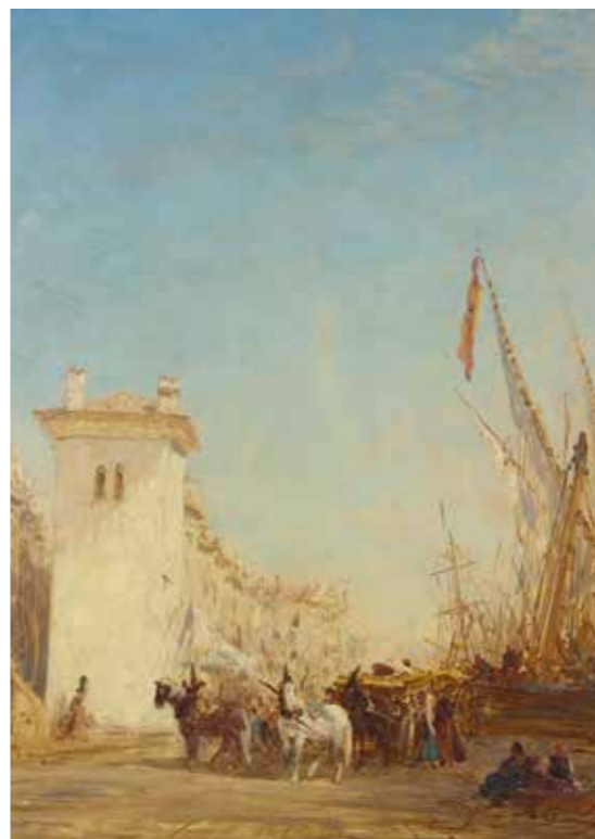
Félix Ziem, Marseille, le quai du port , entre 1890 et 1895, huile sur bois.

À vingt ans, Ziem part à la découverte du Midi, descend la vallée du Rhône jusqu'à Arles puis à Martigues où il séjourne dès 1841. C'est là que va s'affirmer sa vocation de peintre tandis que le port de Marseille lui donne le goût des voyages et de l'exotisme. Face à l'étang de Berre, Ziem forme le projet de créer «une marine méridionale entre Claude Lorrain et Rembrandt». Ce bain de lumière méditerranéenne lui fait écrire «On respire déjà l'air brûlant qui vous enivre des parfums mystérieux de l'Orient».