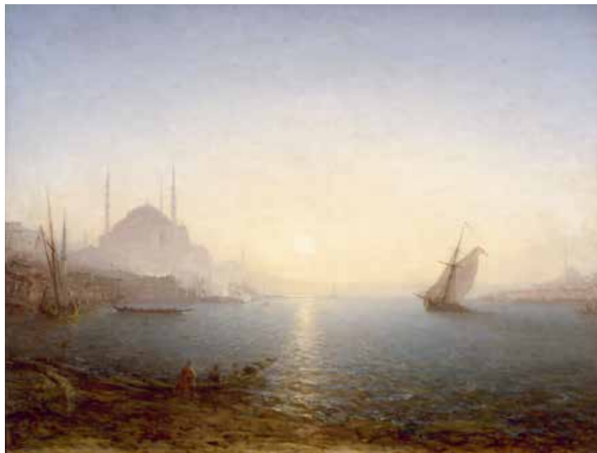
Félix Ziem, Constantinople, Sainte-Sophie au soleil levant , entre 1870 et 1890, huile sur toile.

La multiplicité des techniques employées dans les carnets et les études peintes à l'huile font écho à la diversité des lieux visités par le peintre-voyageur. Fusain, mine de graphite, plume, lavis de sépia, d'encre de chine ou d'aquarelle se succèdent au gré des différents sujets représentés. Dès 1842, Ziem voyage presque tous les ans à l'étranger. L'Italie, la Russie, la Hollande, la Belgique, l'Allemagne, l'Angleterre, l'Écosse, la Tunisie, l'Algérie, la Turquie, le Liban, l'Égypte et la Grèce sont prétextes à tous les genres : paysages, architectures, portraits et copies d'après les maîtres.