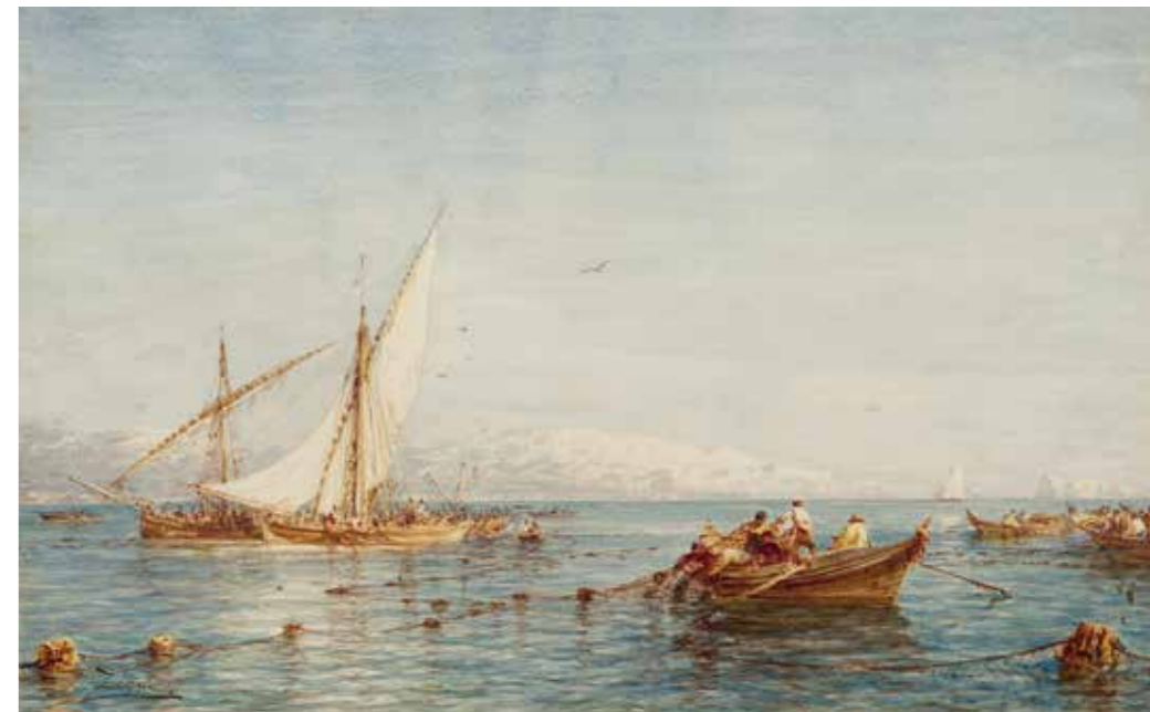
Félix Ziem, Sausset, environs de Marseille, la pêche au thon , sans date, aquarelle sur papier.

pour faire ressortir rochers, voiles, nuages et scintillement de l'eau. Les clairs-obscurs révèlent l'influence des maîtres hollandais et des peintres de Barbizon. Ces brillants effets suscitent chez les critiques d'élogieuses comparaisons avec Francesco Guardi, Mariano Fortuny, et même James Whistler.