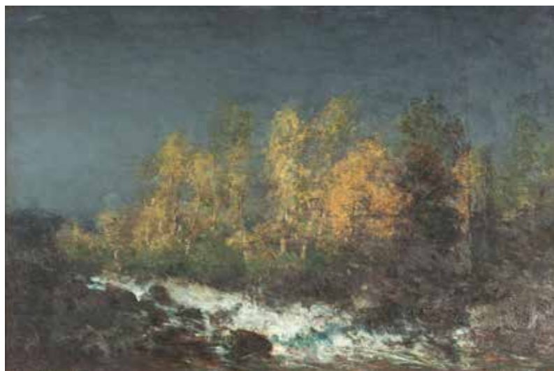
Félix Ziem, Le Torrent, environs de Clermont-Ferrand, entre 1870 et 1880, huile sur bois.

des fermes. Il utilise une roulotte-atelier pour faciliter ses promenades dans la forêt, puis, achète en 1866 une maison à Barbizon. Les croquis sont rapidement brossés devant le motif, tandis qu'au Salon il expose de grands paysages entièrement réinventés.